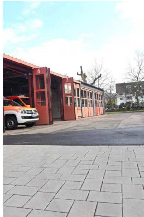
Vor Veränderung: Die Außenanlage der Bühler Feuerwehr

Nach beschränkter Ausschreibung an fünf Baufirmen liegen letztlich drei schriftliche Angebote vor. Zum Zuge soll laut Vorschlag der Verwaltung die Firma Josef Welle in Bühl kommen. Sie habe mit einer Gesamtsumme von knapp 135.000 Euro das akzeptabelste Angebot abgegeben. Die Kostenrechnung der Stadt lag bei 146.000 Euro. Das Angebot läge damit rund acht Prozent (oder 11.000 Euro) unter dem kalkulierten Rahmen.